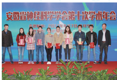
“优秀学生论文奖”颁奖仪式